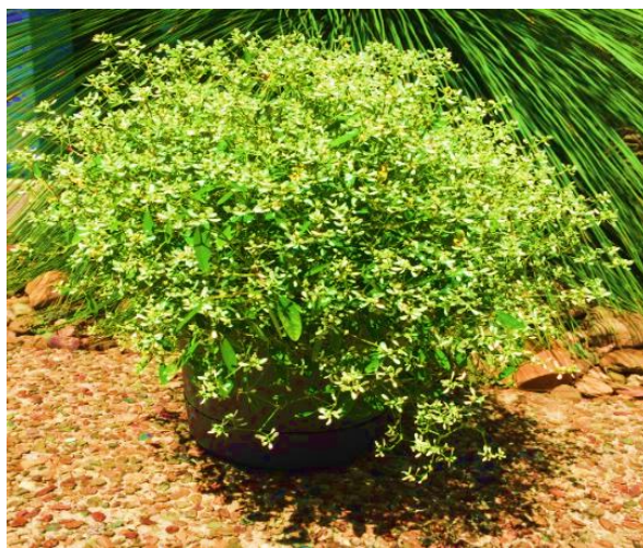
نگاره ۱. تصویر گونه E. hypericifolia مورد استفاده در پرسشنامه.