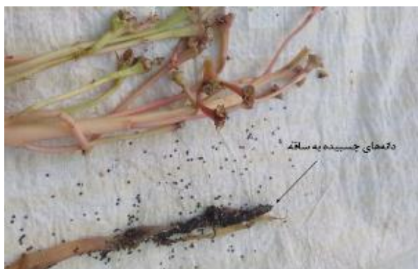
شکل ۳) دانه‌های خرفه چسبیده به ساقه

جهت آزمایش عملکرد ماشین خرمن کوب خرفه و تعیین میزان تلفات کوبنده با توجه به آزمایش‌های اولیه ماشین، مشخص شد تلفات کوبنده به دلیل له شدن ساقه، در سرعت بالای کوبنده اتفاق می‌افتد به این صورت که به محض له شدن ساقه، دانه‌های بسیار ریز به ساقه‌های له شده چسبیده و عملاً اندازه‌گیری تلفات دانه‌های چسبیده به ساقه در قسمت خروجی دستگاه امکان‌پذیر نبود (شکل ۳).