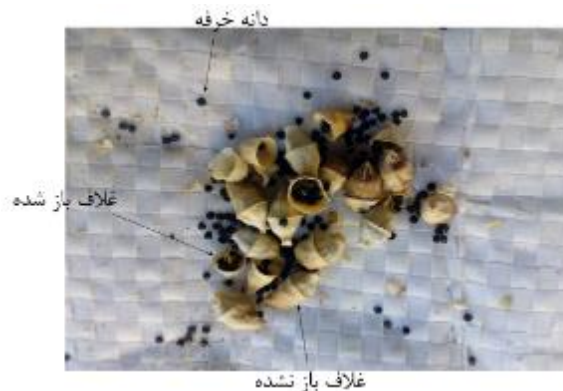
شکل ۴) دانه و غلاف خرفه جدا شده توسط دست

(kg/min)، A وزن کل دانه‌های ورودی (kg/min) می‌باشد.